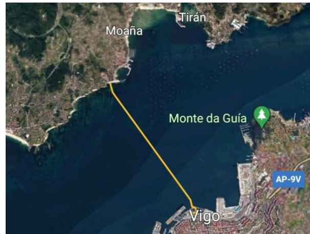
Recorrido completo Élite y Máster/Popular

El recorrido de las pruebas ÉLITE y MÁSTER/POPULAR, constará de una línea recta desde la playa de O Con (Moaña) hasta la dársena interior del Real Club Náutico de Vigo. Será obligatorio nadar entre las boyas y las embarcaciones de seguridad (en las instrucciones técnicas se indicará a qué lado se dejarán las boyas). La salida tendrá lugar desde la playa; la llegada tendrá lugar en un arco flotante, que deberán tocar con la mano en la que llevan puesto el chip.