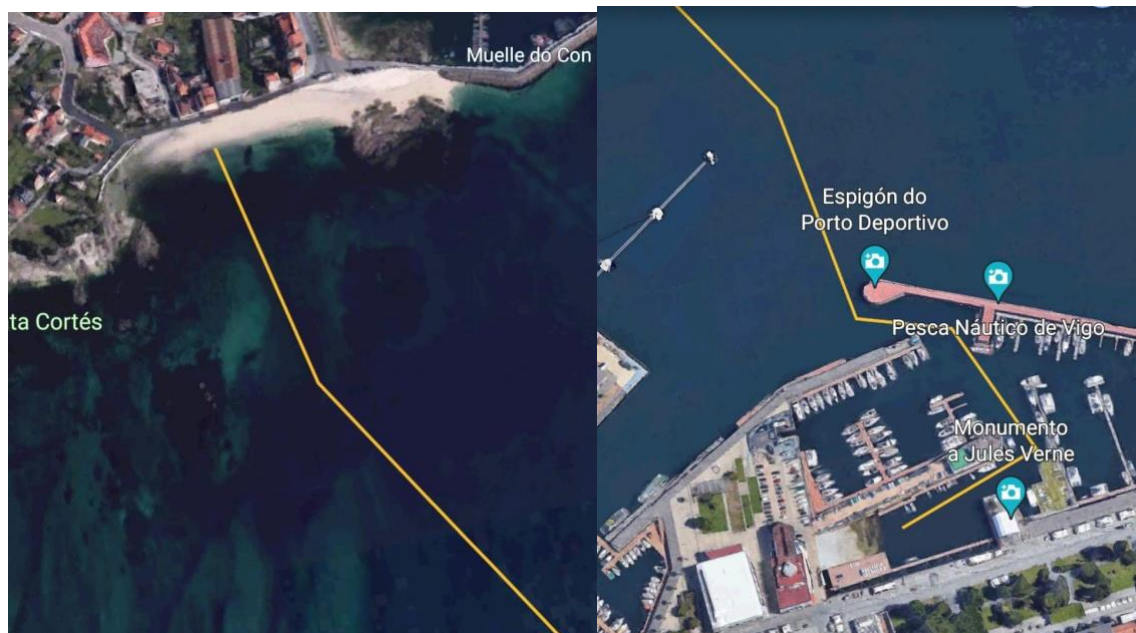
Salida y Llegada Élite y Máster/Popular