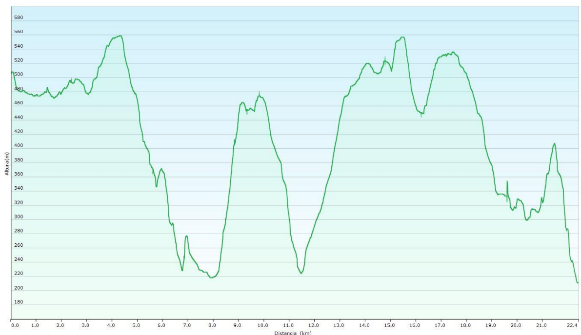
FIGURA 5: RELIEVE PROVA 33K